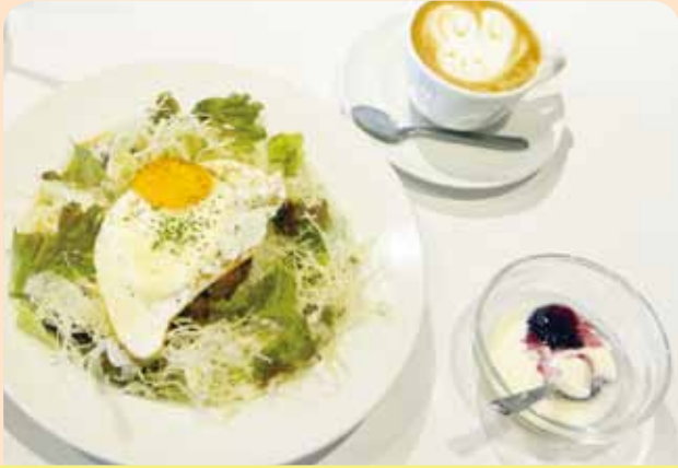
ドライカレーカプチーノセット ¥970 (税込)