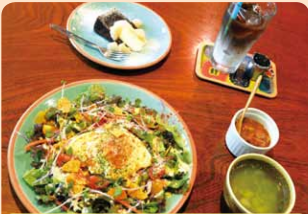
タコライスデザートセット ¥1,410 (税込)