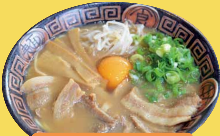
徳島らーめん (肉入り) 中盛り +生卵 ¥760 (税込)