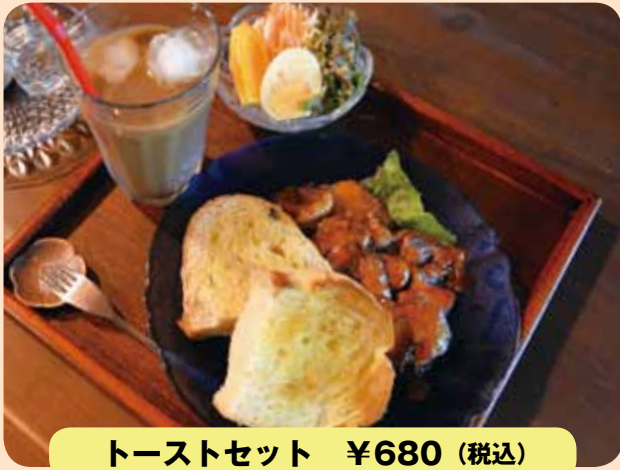
トーストセット ¥680 (税込)