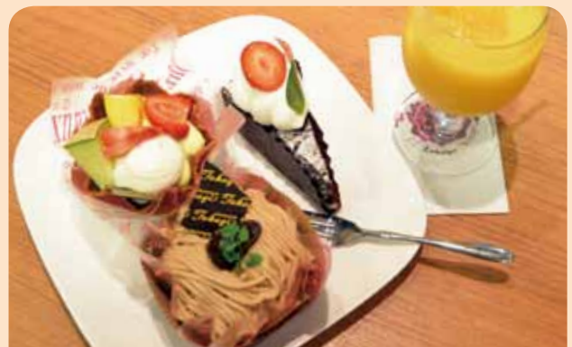
ケーキバイキング (お好きなケーキ 3 個) +ドリンクサービス ¥1,100 円 (税込)

●柏原市国分西 1-2-26 近鉄河内国分駅から徒歩約 2分 ☎ 072-977-0387 9:00 ~ 20:30 年中無休 75席 駐車場有り