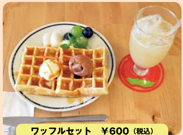
ワッフルセット ¥600 (税込)

●柏原市旭ヶ丘 3-1-48 近鉄河内国分駅から徒歩約5分 ☎072-959-2522 10:30～18:00 日曜日、祝日定休日 18席 駐車場有り