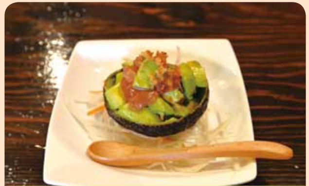
マグロとアボカドの わさびコチュジャン和え ¥650 (税込)

●柏原市国分西 1-1-47 近鉄河内国分駅から徒歩約3分 ☎090-6052-2548 9:00 ~ 14:00、18:00 ~ 23:00 (L.O 閉店 30分前) 日曜日定休日 15席 駐車場無し