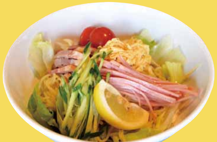
冷やし中華 ¥810 (税込) 季節限定

お酢をきかせてさっぱり仕上げた冷やし中華や、麻婆豆腐、油淋鶏などのメニューは全て、中華料理店で腕を磨いた店主・鈴木さんによる本格創作中華料理。「遊べて、飲めて、食べて」がテーマの店内では、ダーツやテーブルサッカーゲームも楽しめる。学生限定で、食後に食器を運ぶとお会計が1割引になる「お片付け割引」など、遊び心のあるサービスも魅力。