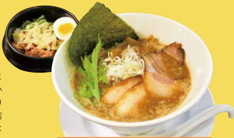
濃厚ブラックラーメン リゾットセット ¥980 (税込)

鶏白湯でパンチを効かせた「濃厚ブラックラーメン」は、他店には無い味を追求した、オープン時からの看板メニュー。「新しいラーメンの開発に取り組み、常にわくわく感を作っていきたい」と話す店主の甲斐さん。店名は108の煩惱(10:テン、8:パ)を意味し、食欲を刺激する店でありたいという熱い思いが込められている。