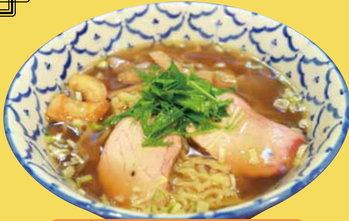
いぶ 燻しラーメン ¥800 (税込)