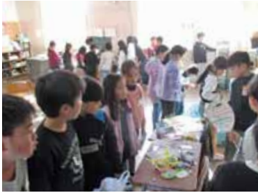
わいわいワールド