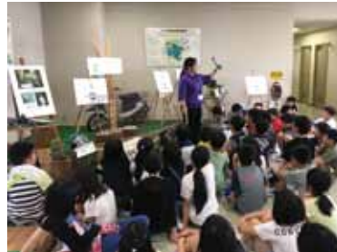
グリーンセンター見学