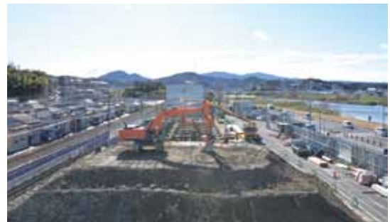
▲新庁舎の整備状況(1月28日時点)