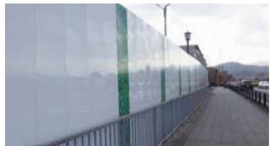
▲絵の展示スペース