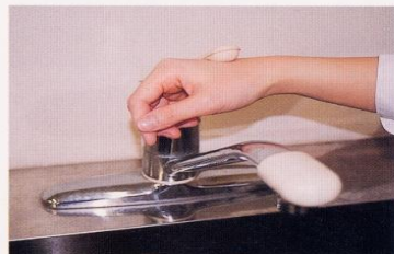
7. 水道の栓を止めるときは、手首か肘で止める。できないときは、ペーパータオルを使用して止める