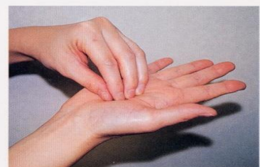
3. 指先、爪の間をよく洗う