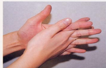
4. 指の間を十分に洗う