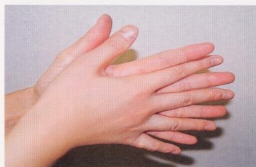
1. 手のひらを合わせ、よく洗う