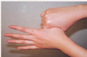
5. 親指と手掌をねじり洗いする