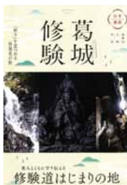
▲公式パンフレット