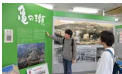
▲亀の瀬地すべり歴史資料室