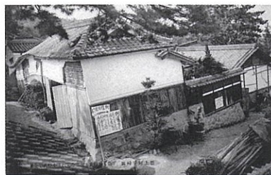
▲ 亀の瀬地すべりの被害を伝える絵はがき