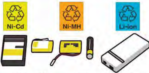
● ニカド電池 ● ニッケル水素電池