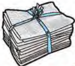
しんぶんし 新聞紙

ひもでまとめて出してください。 お住まいの地域で古紙の集団回収を行っている場合はそちらを優先してください。