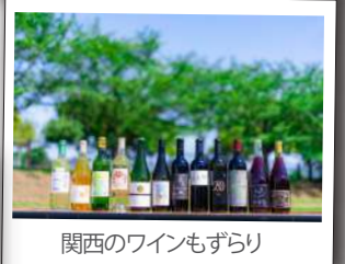
関西のワインもずらり