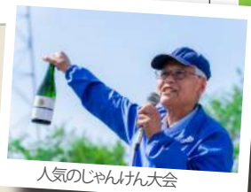
人気のじゃんけん大会

大阪ワインに加えて、関西ワイン(兵庫、滋賀、京都、奈良、和歌山)からワイナリーが参加! 各社おすすめ赤、白、ロゼワインなどが勢ぞろい! 自分好みのワインを探してみてください。