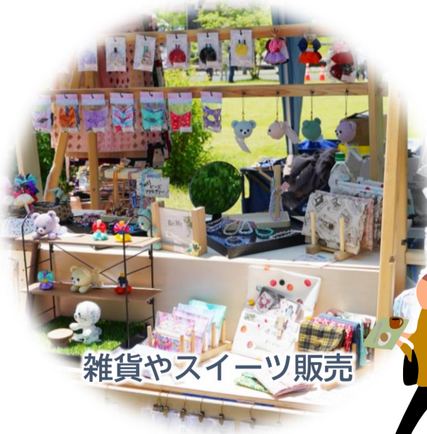
雑貨やスイーツ販売